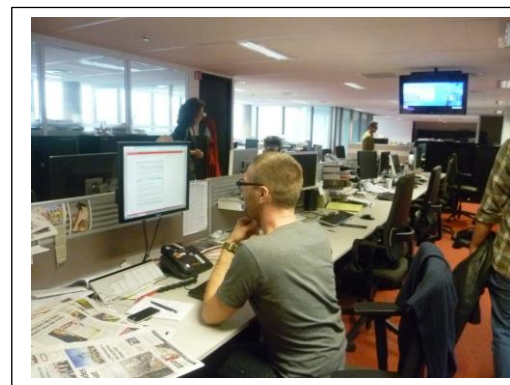
Une des salles où travaillent les journalistes dans Sud - Ouest

« Le journalisme a moins d'influence aujourd'hui »