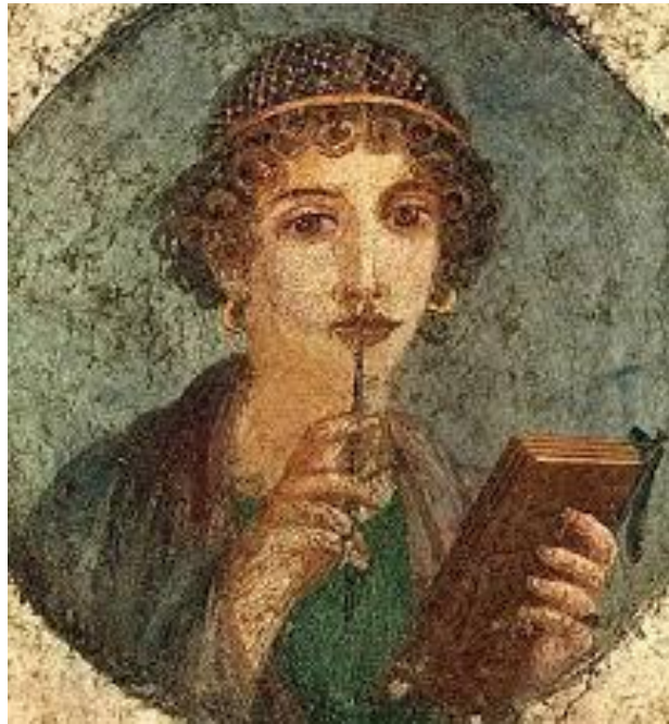
Sappho, la poétesse