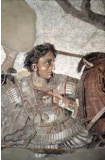
Alexandre, le guerrier