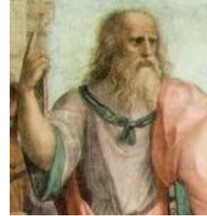
Platon, le philosophe